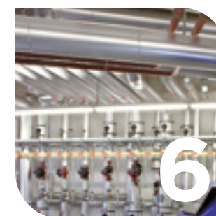
Tecnica di riscaldamento