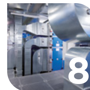
Tecnica di ventilazione e climatizzazione