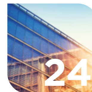
Facility & Property Management