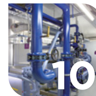
Tecnica del freddo